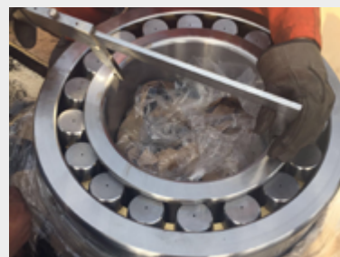
Сферический роликовый подшипник RKB