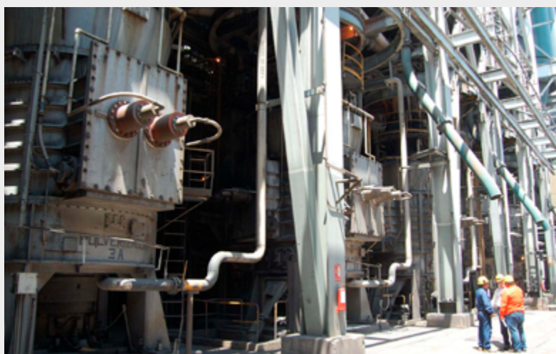
Технические специалисты RKB на электростанции