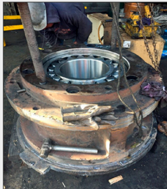
Монтаж подшипника в роликовую мельницу

Компания RKB приобрела завидный опыт, знания и высокий уровень надёжности в данном применении, добившись превосходных результатов в поставках подшипников для наиболее ответственных узлов углеразмольных мельниц, таких как мелющие ролики и редукторы скорости стола углеразмольной мельницы.