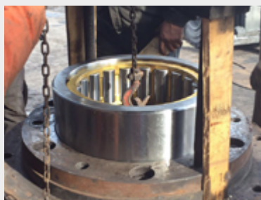
Цилиндрический роликовый подшипник RKB

Все эти технологии, подкрепленные постоянным присутствием технических специалистов RKB на месте установки, максимально увеличивают общий срок службы подшипников. В результате повышается общая эксплуатационная надежность углеразмольной мельницы.