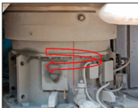
Редуктор скорости стола углеразмольной мельницы

RKB Bearing Industries Group - швейцарское производственное предприятие, в подшипниковой промышленности более 70 лет, с ежемесячным объемом производства свыше 350 тон обработанной стали. Благодаря накопленному за годы работы опыту, компания RKB обладает уникальными практическими знаниями и навыками, необходимыми для разработки технологичных промышленных подшипников с наружным диаметром до 1925 мм. Компания RKB предлагает надежные и эффективные с экономической точки зрения решения, повышенную эксплуатационную гибкость, обслуживание на высочайшем уровне, большие объемы складских запасов, короткие сроки доставки и неизменно высокое качество стабильного поставщика подшипников премиум-класса. Благодаря своей всемирной дистрибьюторской сети и экспортному присутствию в более чем 50 странах, компания RKB признана во всем мире как «Альтернативный источник энергии» в подшипниковой промышленности.